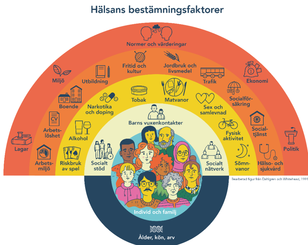
Bild: Faktorer och sammanhang som påverkar människors hälsa. Den yttre cirkeln visar hur världen påverkar oss, nästa visar situationer som man själv inte kan påverka. Sedan är det den enskildes sätt att leva och den närmast människan handlar om vänner och familjeförhållanden.

Folkhälsoplanen är tidsbestämd och innehåller tydliga mål och inriktningar för den aktuella perioden med planerade aktiviteter som ska genomföras för att nå de uppsatta målen. Mål och genomförda aktiviteter för folkhälsan ska följas upp enligt folkhälsoplan som revideras årligen.