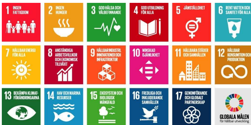
Figur 1. De 17 globala målen som utgör Agenda 2030.

FN:s 193 medlemsländer antog 2015 Agenda 2030, den mest ambitiösa överenskommelsen hittills, som har en universell agenda med 17 globala mål för hållbar utveckling. Hållbar utveckling innebär både ekonomisk, social och miljömässig hållbarhet.