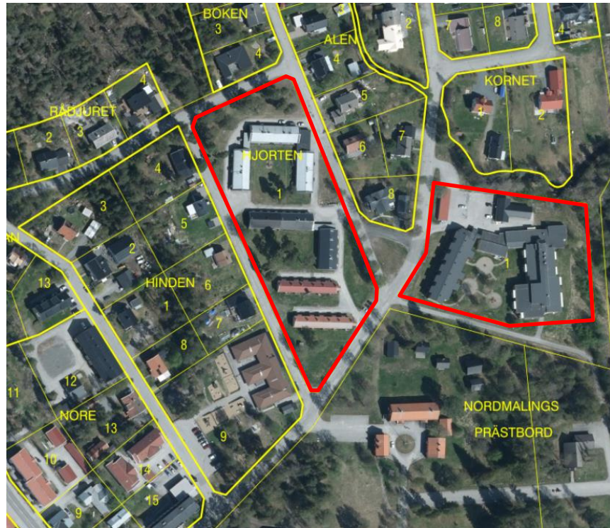
Översiktskarta med fastighetsgränser, planområdet markeras med rött.